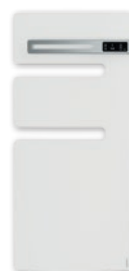
Czysta biel (Mat)