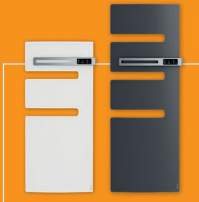
model WHITE model ANTHRACITE